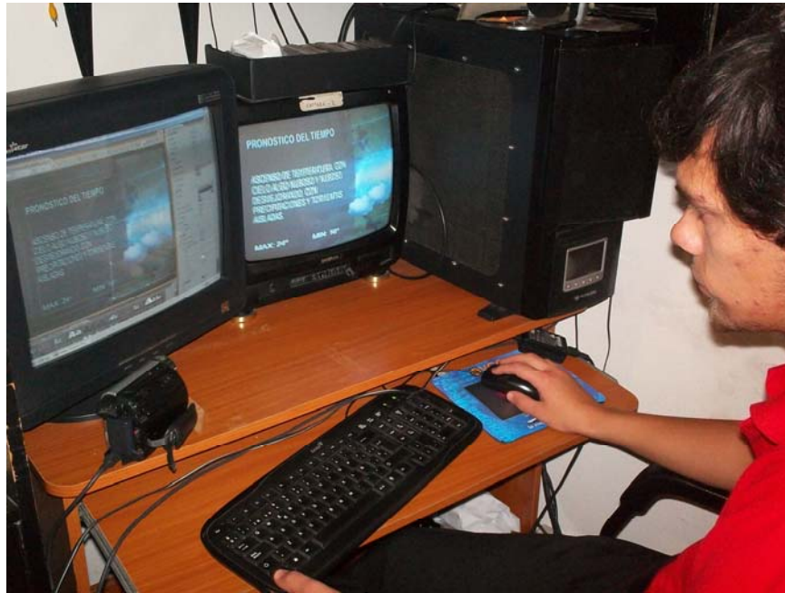
ISLA DE EDICIÓN – MATROX RTX2 EQUIPO DE ÚLTIMA GENERACIÓN