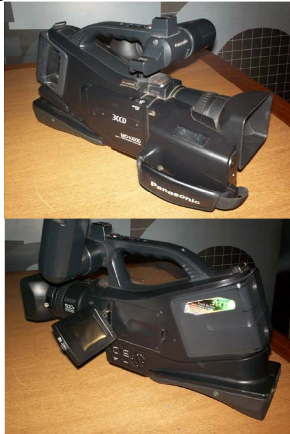
CÁMARAS DE GRABACIÓN DIGITAL EN MINI DV (MARCA PANASONIC – MODELO NV MD 10000)