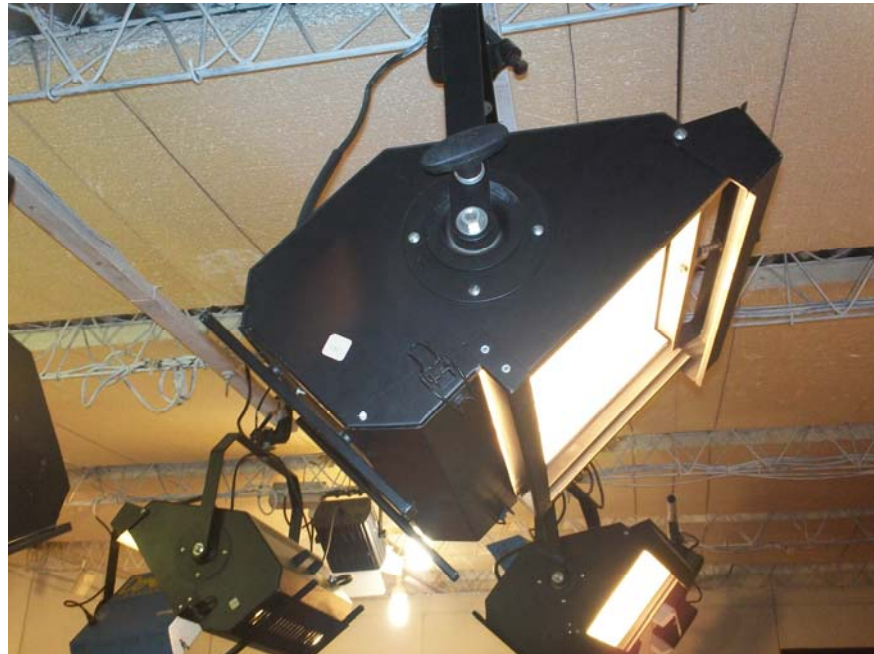
ILUMINACIÓN DEL ESTUDIO CON EQUIPOS PROFESIONALES (MARCA DEXEL)