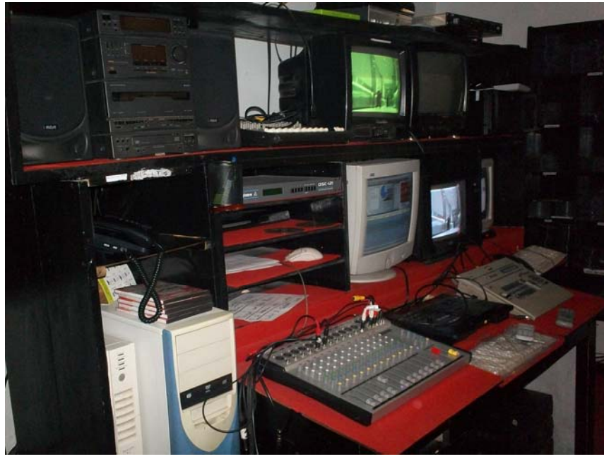
CONTROL DE EMISIÓN AL AIRE