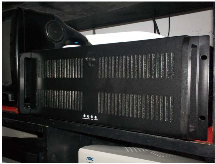
GENERADORA DE CARACTÉRES, GRÁFICOS Y LOGOS PARA LA SALIDA AL AIRE. (MARCA CG5 MULTICHANNEL). EQUIPO DE ÚLTIMA GENERACIÓN, ADQUIRIDO RECIENTEMENTE