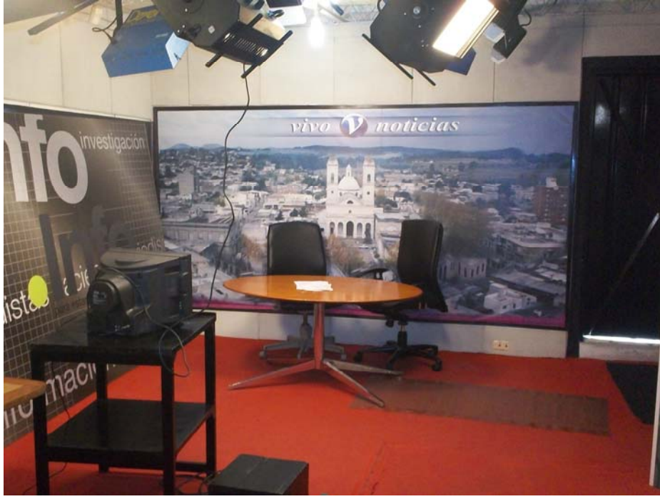
ESTUDIO DE CANAL 3